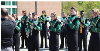
Competición de bandas