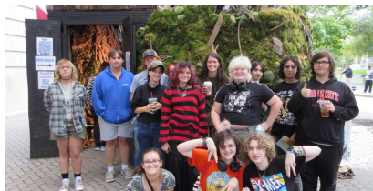
Club de Arte en Art Price