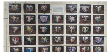
Exhibición de obras artísticas de los estudiantes